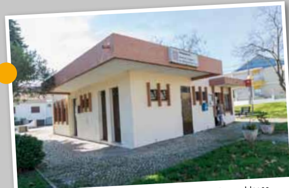
Sede da Associação Unitária de Reformados, Pensionistas e Idosos do Casal do Marco