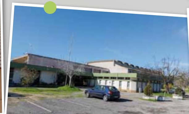
Impermeabilização da cobertura do edifício-sede do Clube do Pessoal da Siderurgia Nacional