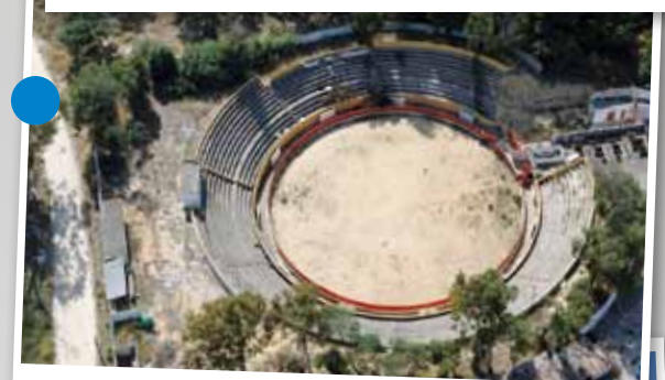
Praça de touros do Paio Pires Futebol Clube