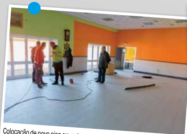
Colocação de novo piso em sala multiusos da Sociedade Filarmónica União Seixalense