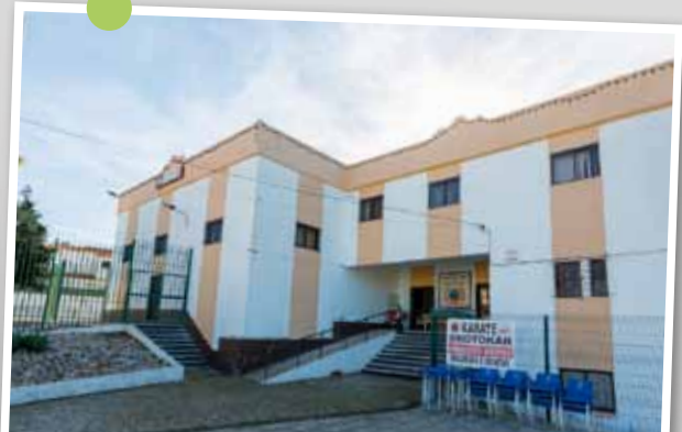
Reparação da cobertura e pavimento da Associação de Amigos do Pinhal do General