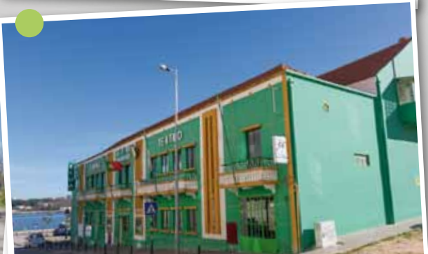
Substituição da cobertura do edifício-sede da Sociedade Filarmónica Operária Amorense