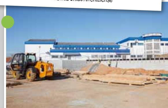
Centro de Solidariedade Social de Pinhal de Frades