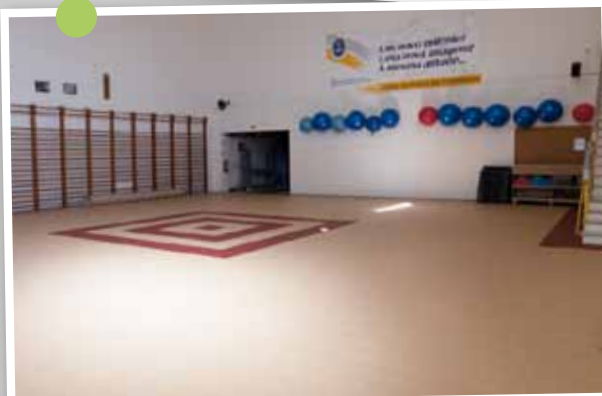
Reparação do piso do ginásio da Casa do Povo de Corroios