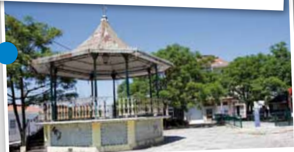
Coreto de Aldeia de Paio Pires