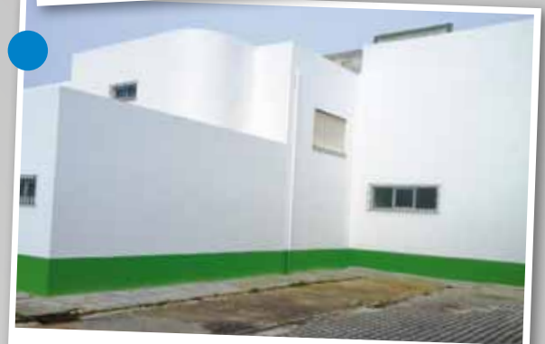
Sede da Sociedade Filarmónica União Arrentelense