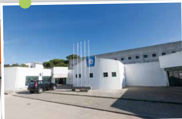
Recuperação da cobertura do edifício do Grupo Desportivo, Cultural e Recreativo da Quinta da Princesa