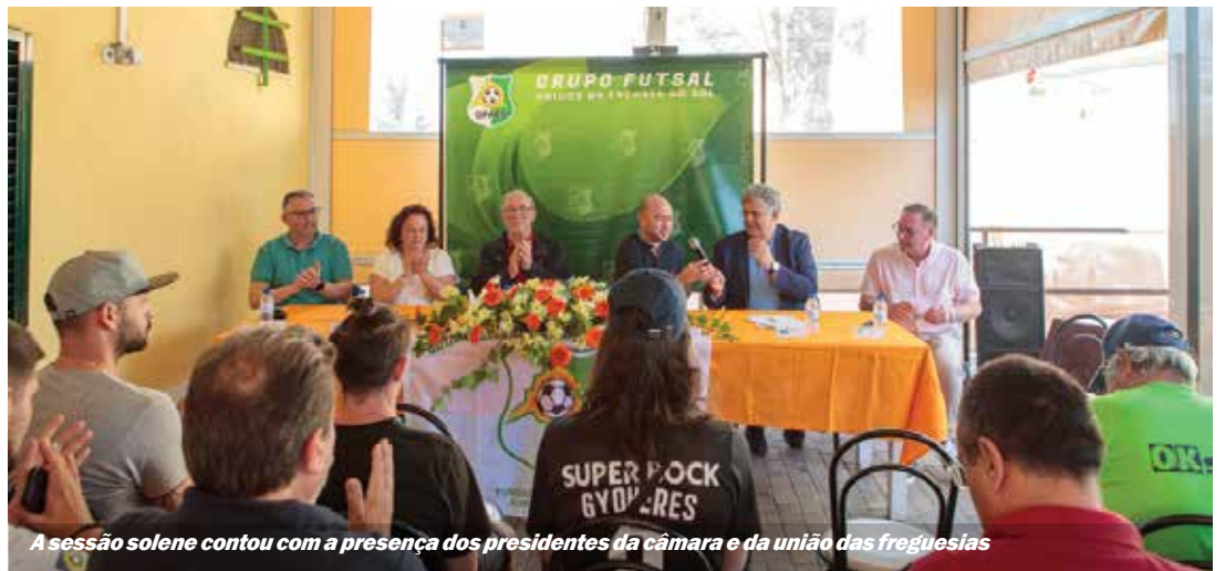
A sessão solene contou com a presença dos presidentes da câmara e da união das freguesias

Paulo Silva, presidente da Câmara Municipal do Seixal, compareceu na iniciativa e saudou o trabalho e a coragem da dedicação aos projetos que melhor servem a população idosa do concelho, seja na dinamização de atividades, seja em investimentos em equipamentos, como o Equipamento Integrado para Pessoas Idosas – Estrutura Residencial para Pessoas Idosas que a ARPIFF está a construir num terreno com cerca de 4 950,80 metros quadrados atribuído pela autarquia.