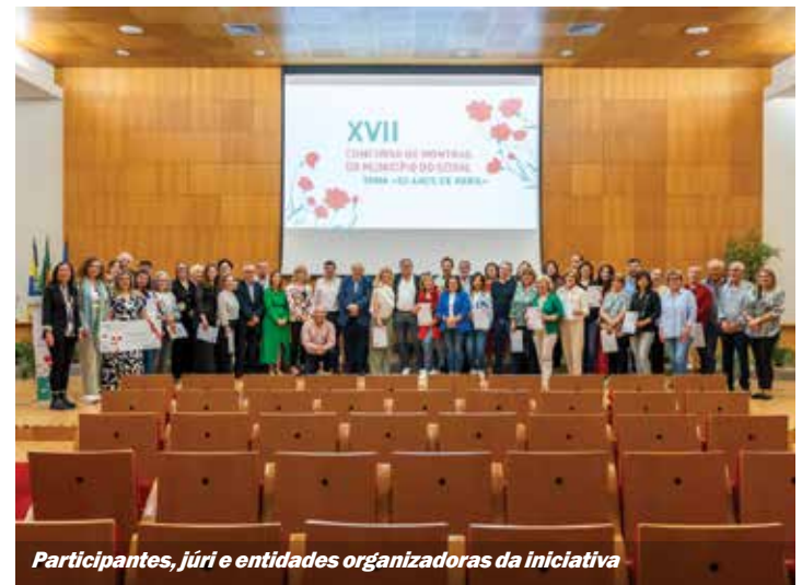
Participantes, júri e entidades organizadoras da iniciativa

O autarca adiantou «os empresários são essenciais para o crescimento do concelho e a valorização do território e isso reflete-se na qualidade de vida, atualmente mais de metade da população já trabalha no concelho».