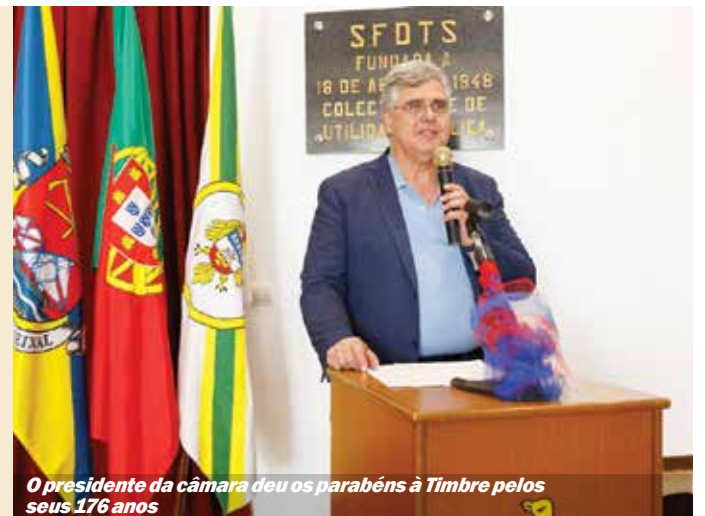
O presidente da câmara deu os parabéns à Timbre pelos seus 176 anos