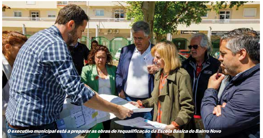
O executivo municipal está a preparar as obras de requalificação da Escola Básica do Bairro Novo