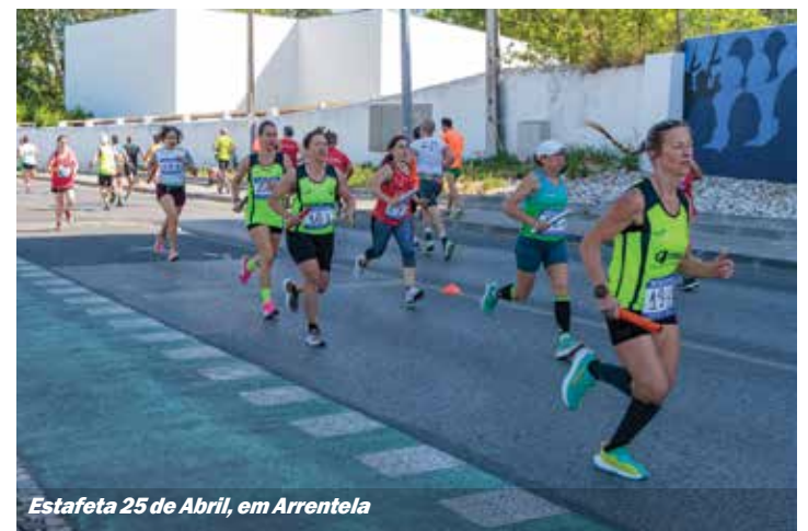
Estafeta 25 de Abril, em Arrentela