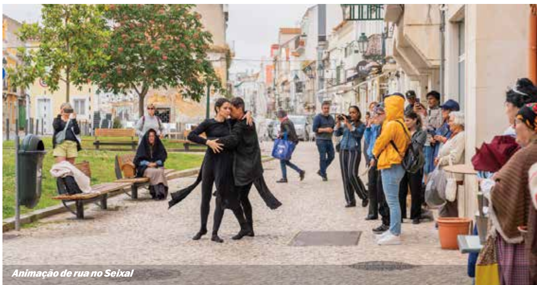
Animação de rua no Seixal