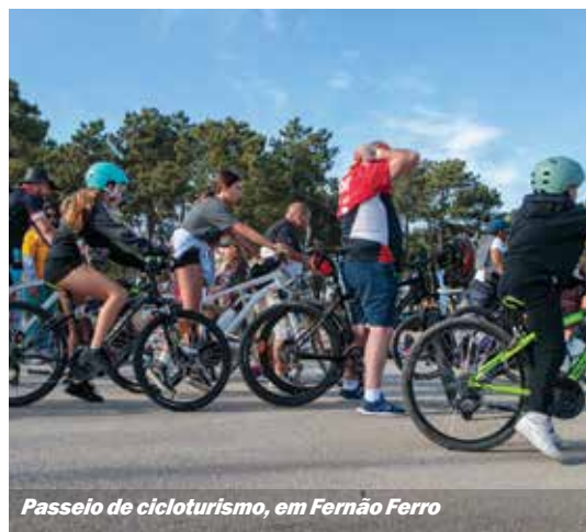
Passeio de cicloturismo, em Fernão Ferro