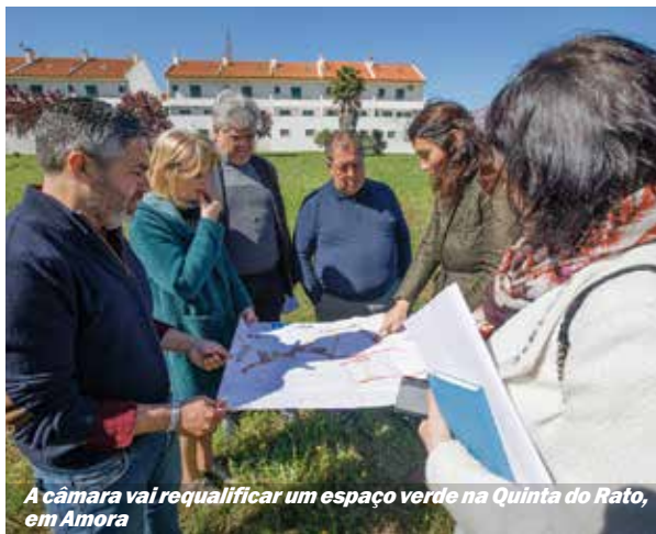
A câmara vai requalificar um espaço verde na Quinta do Rato, em Amora