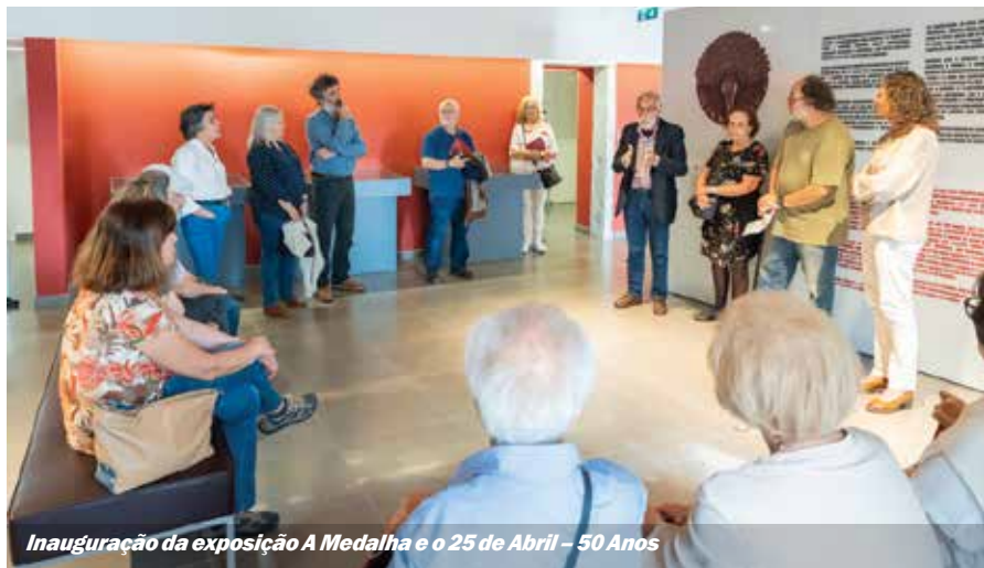
Inauguração da exposição A Medalha e o 25 de Abril – 50 Anos