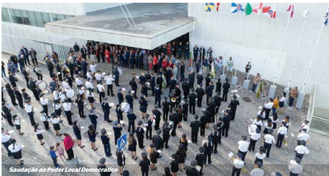
Saudação ao Poder Local Democrático

Homenagem ao Poder Local Democrático e ao 25 de Abril