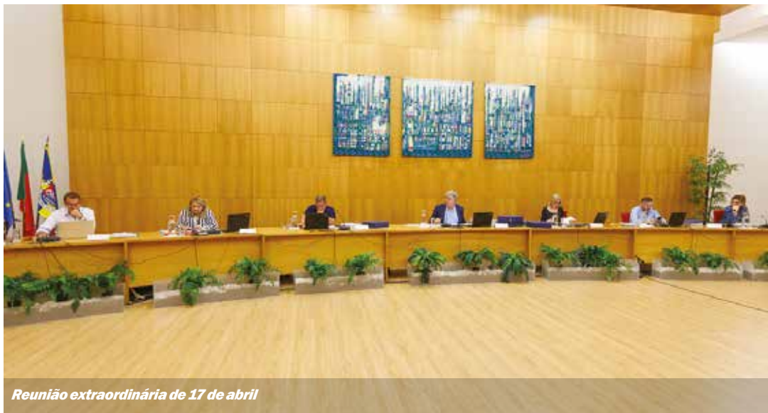
Reunião extraordinária de 17 de abril

tivos e suplentes) para o biénio judicial 2023-2025. Aprovação.