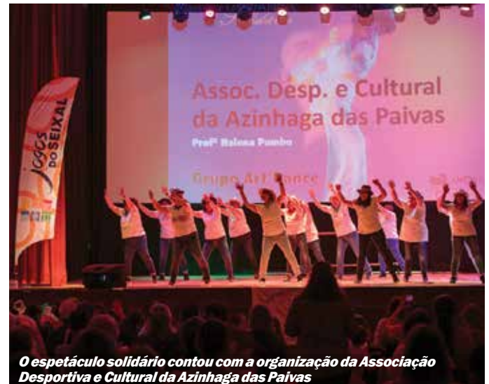
O espetáculo solidário contou com a organização da Associação Desportiva e Cultural da Azinhaga das Paivas

América que dura há 65 anos, Cuba foi incluída em 2021 pela administração Trump na lista unilateral de alegados países promotores de terrorismo. Para além desta reinserção, ao longo do seu mandato, o presidente republicano reforçou o bloqueio com 243 medidas coercivas adicionais, o que motivou Biden a declarar durante a campanha eleitoral que iria mudar as políticas do seu antecessor no cargo, o que nunca sucedeu.