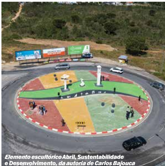
Elemento escultórico Abril, Sustentabilidade e Desenvolvimento, da autoria de Carlos Bajouca