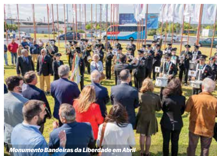
Monumento Bandeiras da Liberdade em Abril