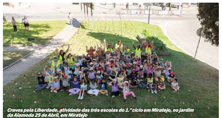
Cravos pela Liberdade, atividade das três escolas do 1.º ciclo em Miratejo, no jardim da Alameda 25 de Abril, em Miratejo