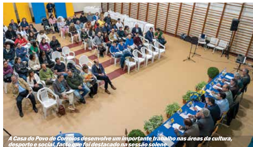
A Casa do Povo de Corroios desenvolve um importante trabalho nas áreas da cultura, desporto e social, facto que foi destacado na sessão solene