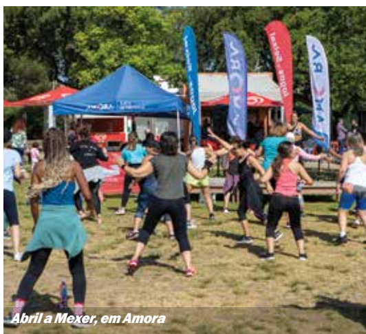
Abril a Mexer, em Amora