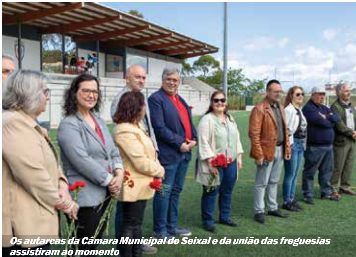
Os autarcas da Câmara Municipal do Seixal e da união das freguesias assistiram ao momento