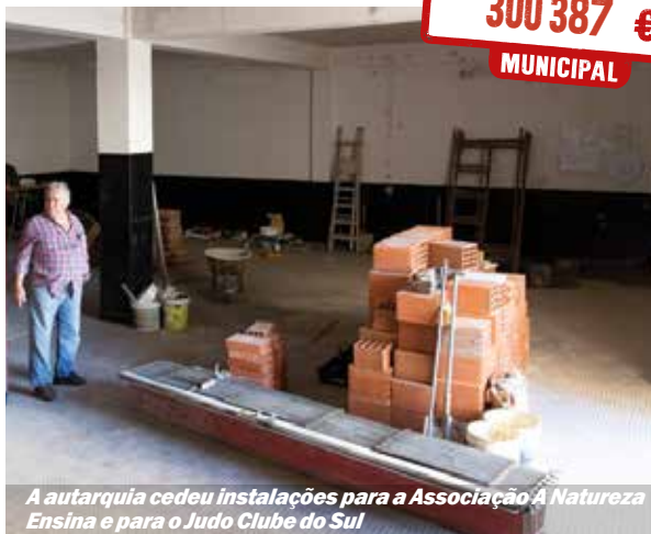
A autarquia cedeu instalações para a Associação A Natureza Ensina e para o Judo Clube do Sul