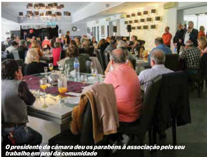
O presidente da câmara deu os parabéns à associação pelo seu trabalho em prol da comunidade