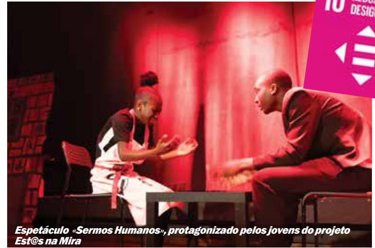
Espectáculo «Sermos Humanos», protagonizado pelos jovens do projeto Est@s na Mira

cravatura, a desigualdade de género, os maus-tratos infantis e os direitos que qualquer ser humano deve ter, esta é uma pequena peça criada por jovens para toda a comunidade, como forma de reflexão sobre o mundo em que vivemos e o mundo onde sonhamos viver.