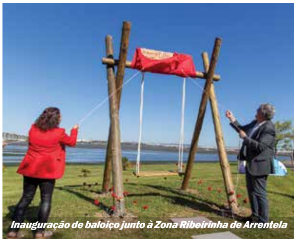
Inauguração de baloiço junto à Zona Ribeirinha de Arrentela