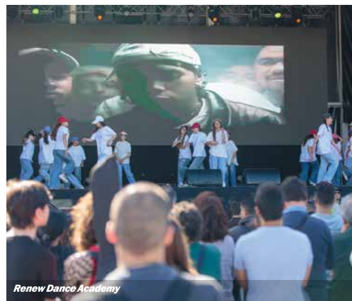
Renew Dance Academy

No dia 28 de abril subiram ao palco a Renew Dance Academy, com o espetáculo «15-25», e a Escola de Rock do Seixal, mostrando os jovens valores do concelho na dança e na música. ■