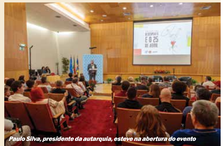
Paulo Silva, presidente da autarquia, esteve na abertura do evento

lhoria da qualidade de vida. De acordo com o presidente da Câmara Municipal do Seixal, Paulo Silva, que esteve na abertura do encontro, tem sido feito «todo um trabalho em prol do desenvolvimento desportivo no concelho». No Seixal, o conceito do Desporto para Todos é um fator de desenvolvimento social, económico e cultural, sempre em colaboração com as coletividades e os estabelecimentos de ensino, bem como as instituições da área social. É desta forma que se cria uma rede e uma dinâmica de participação