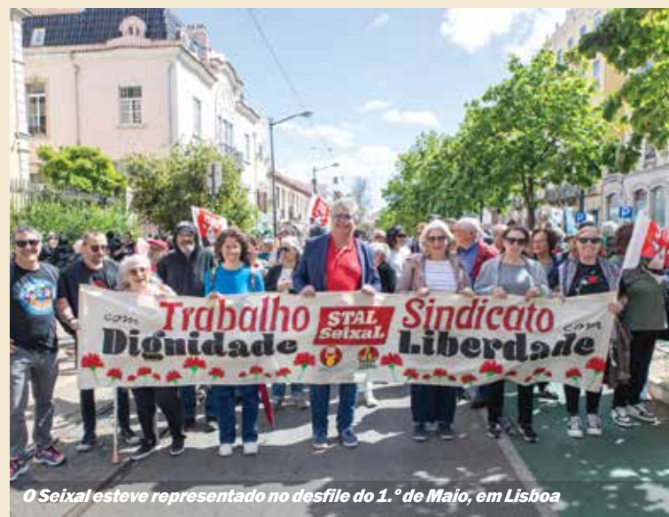
O Seixal esteve representado no desfile do 1.º de Maio, em Lisboa

associações e sindicatos ligados aos setores da educação, segurança, comércio e indústria. Em passo lento, empunhando bandeiras e faixas, palavras de ordem em contexto de luta de trabalhadores fizeram-se ouvir, numa clara demonstração dos trabalhadores que os valores de Abril estão bem presentes como há 50 anos.