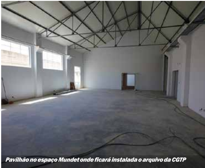
Pavilhão no espaço Mundet onde ficará instalada o arquivo da CGTP