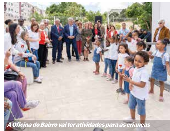
A Oficina do Bairro vai ter atividades para as crianças