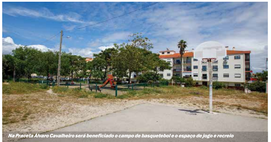
Na Praceta Álvaro Cavalheiro será beneficiado o campo de basquetebol e o espaço de jogo e recreio

Visita à freguesia do Seixal pelos executivos da câmara e junta