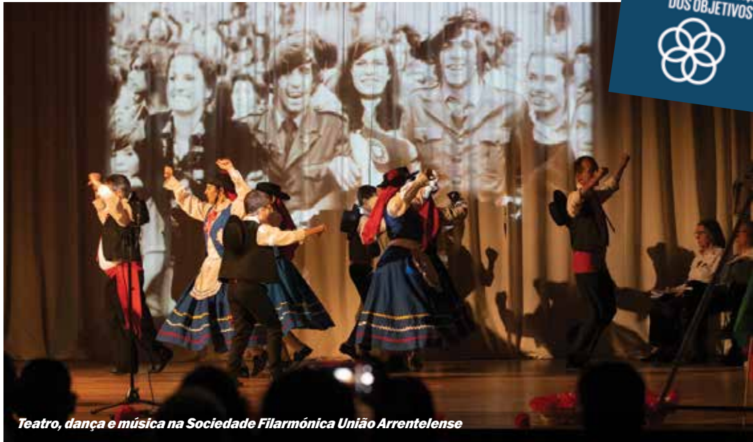
Teatro, dança e música na Sociedade Filarmónica União Arrentelense