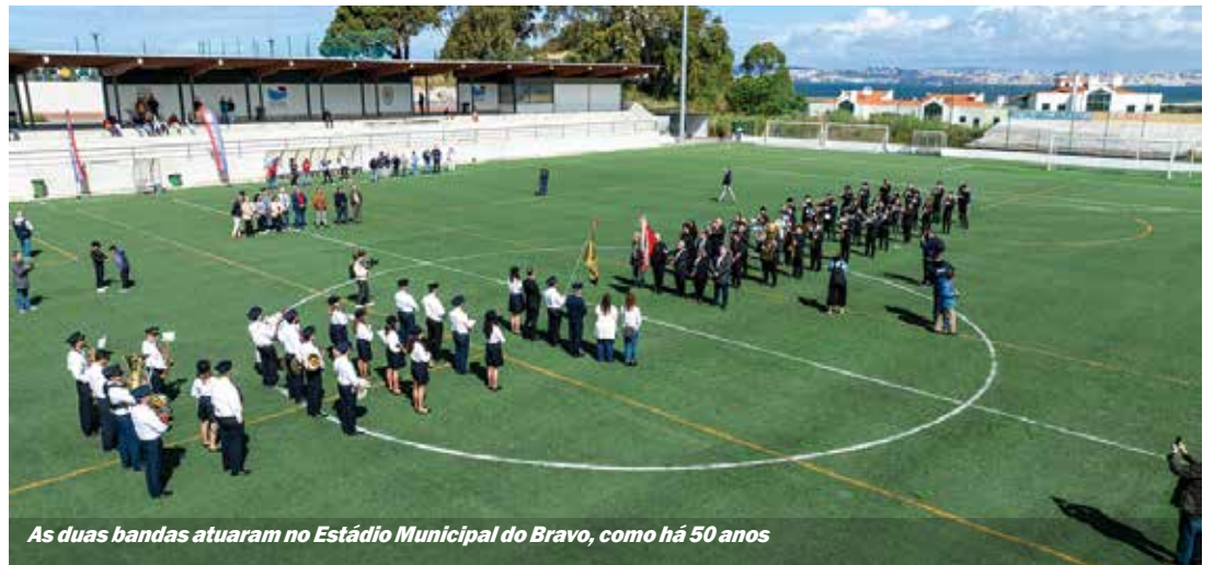
As duas bandas atuaram no Estádio Municipal do Bravo, como há 50 anos

NO DIA 1 de maio de 2024 celebraram-se os 50 anos das pazes entre a Sociedade Filarmónica Democrática Timbre Seixalense e a Sociedade Filarmónica União Seixalense.