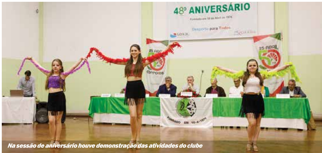
Na sessão de aniversário houve demonstração das atividades do clube