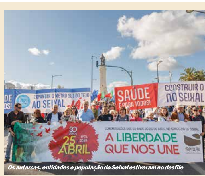
Os autarcas, entidades e população do Seixal estiveram no desfile

O dia em que se celebraram as conquistas de Abril e se fez um balanço dos 50 anos de democracia também foi tempo de reivindicação de direitos conquistados com a Revolução dos Cravos, nomeadamente na área da saúde, com faixas que lembraram a necessidade urgente da construção do hospital no Seixal e a expansão do Metro Sul do Tejo.