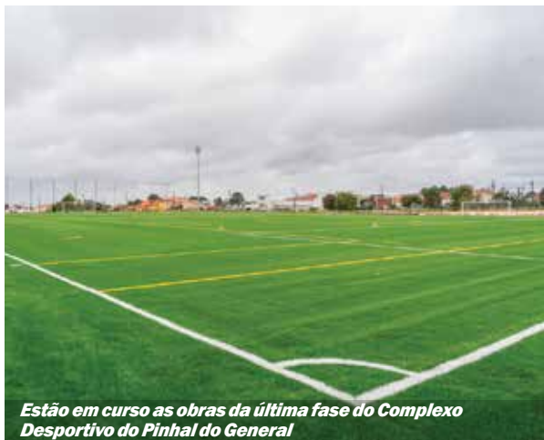
Estão em curso as obras da última fase do Complexo Desportivo do Pinhal do General