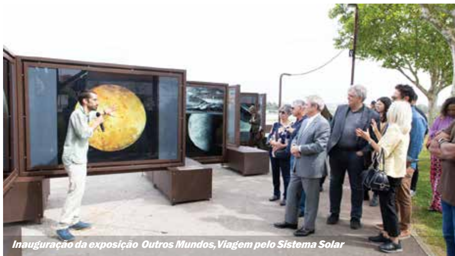
Inauguração da exposição Outros Mundos, Viagem pelo Sistema Solar