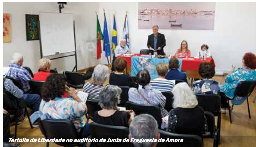
Tertúlia da Liberdade no auditório da Junta de Freguesia de Amora