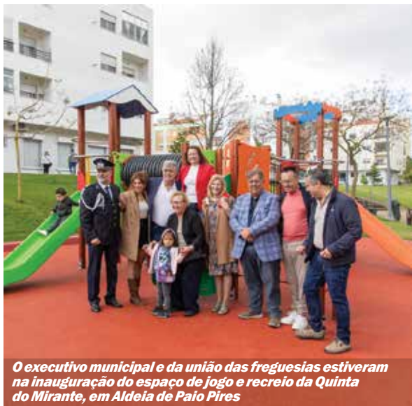
O executivo municipal e da união das freguesias estiveram na inauguração do espaço de jogo e recreio da Quinta do Mirante, em Aldeia de Paio Pires