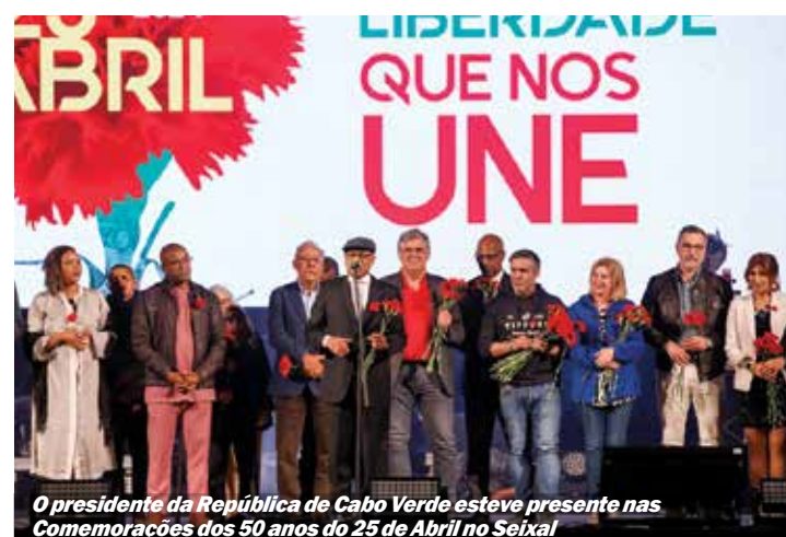
O presidente da República de Cabo Verde esteve presente nas Comemorações dos 50 anos do 25 de Abril no Seixal