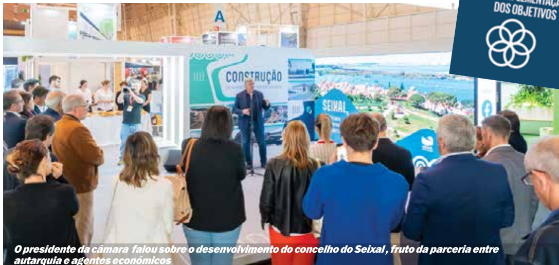
O presidente da câmara falou sobre o desenvolvimento do concelho do Seixal, fruto da parceria entre autarquia e agentes económicos

Estiveram presentes cerca de três dezenas de técnicos municipais do turismo, que ao longo do dia tiveram oportunidade de conhecer as potencialidades turísticas do concelho do Seixal, bem como participar numa visita guiada aos vários recursos patrimoniais, culturais e naturais do Seixal.