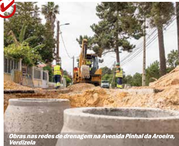
Obras nas redes de drenagem na Avenida Pinhal da Aroeira, Verdizela