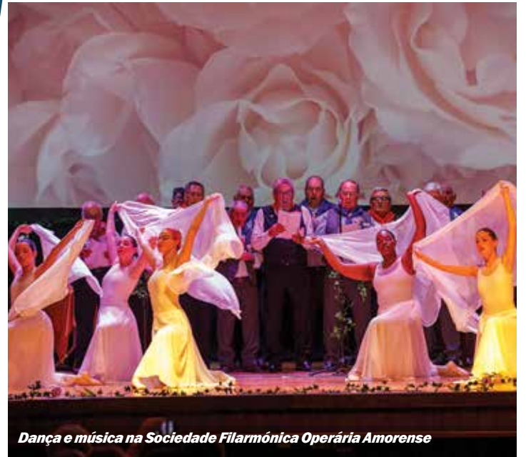
Dança e música na Sociedade Filarmónica Operária Amorense