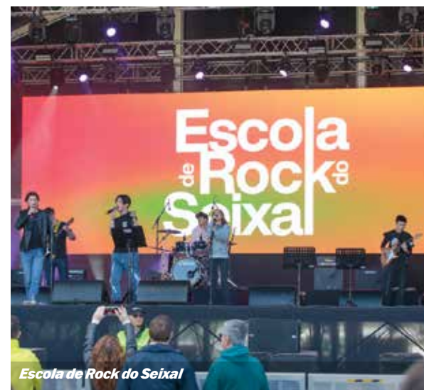
Escola de Rock do Seixal