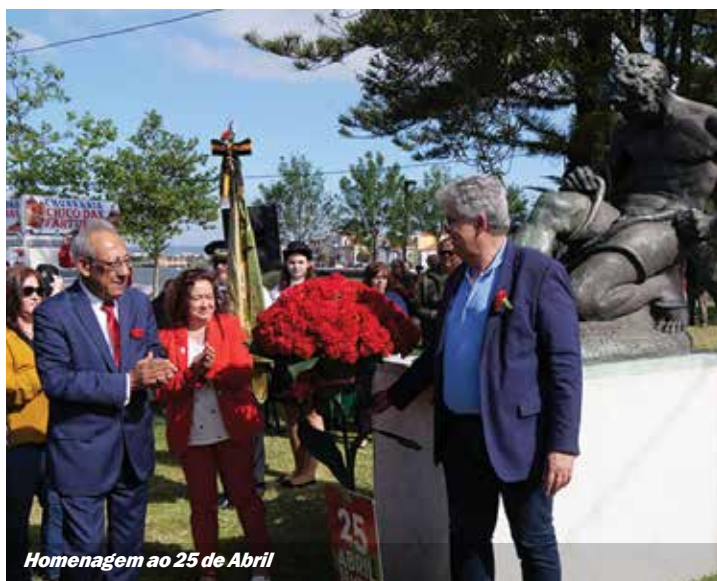
Homenagem ao 25 de Abril