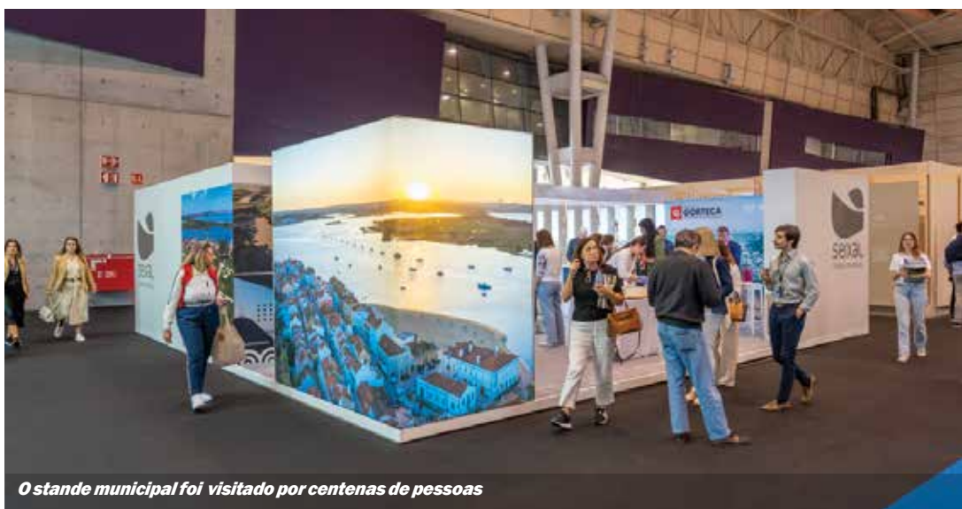
O stande municipal foi visitado por centenas de pessoas

17 PARCERIAS PARA A IMPLEMENTAÇÃO DOS OBJETIVOS