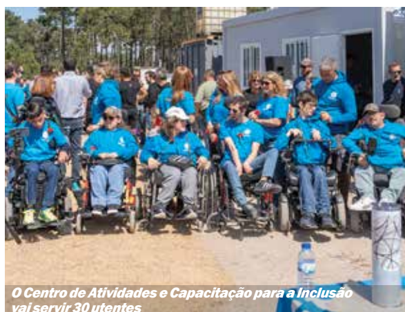
O Centro de Atividades e Capacitação para a Inclusão vai servir 30 utentes