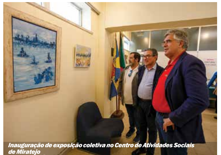
Inauguração de exposição coletiva no Centro de Atividades Sociais de Miratejo