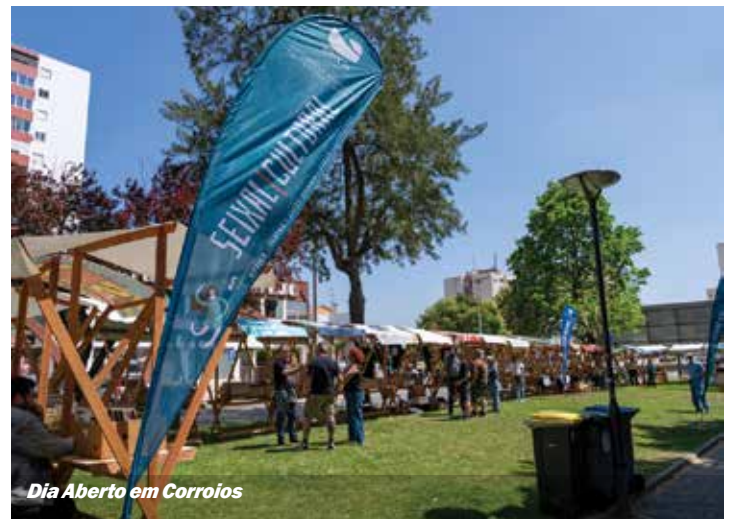
Dia Aberto em Corroios

O programa contou ainda com um conjunto de workshops em áreas diversificadas naquilo que foi também uma aposta no envolvimento de um público mais jovem. ■