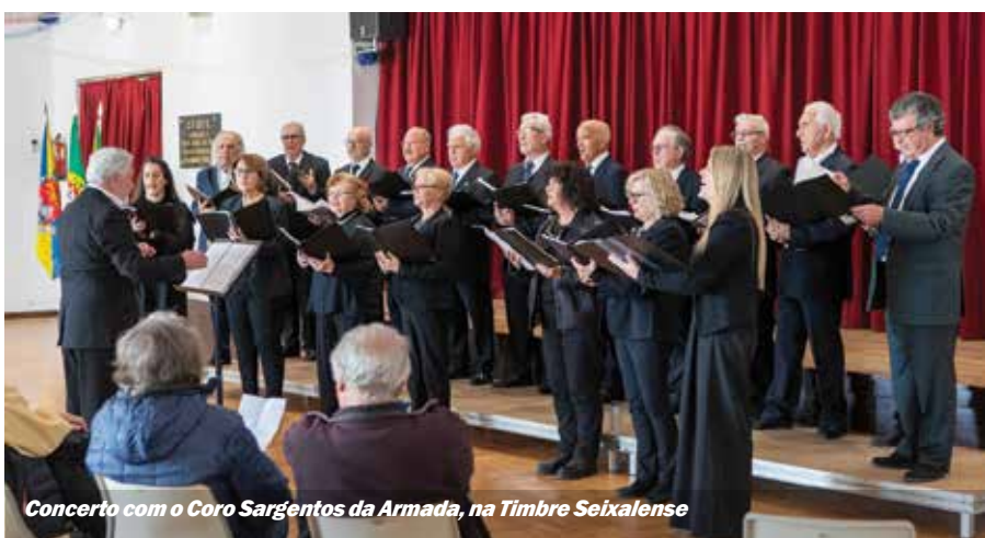
Concerto com o Coro Sargentos da Armada, na Timbre Seixalense

Seguiu-se a deslocação até ao Monumento do 1.º de Maio, onde foi prestada desta forma também uma homenagem a todos os trabalhadores do município do Seixal. ■