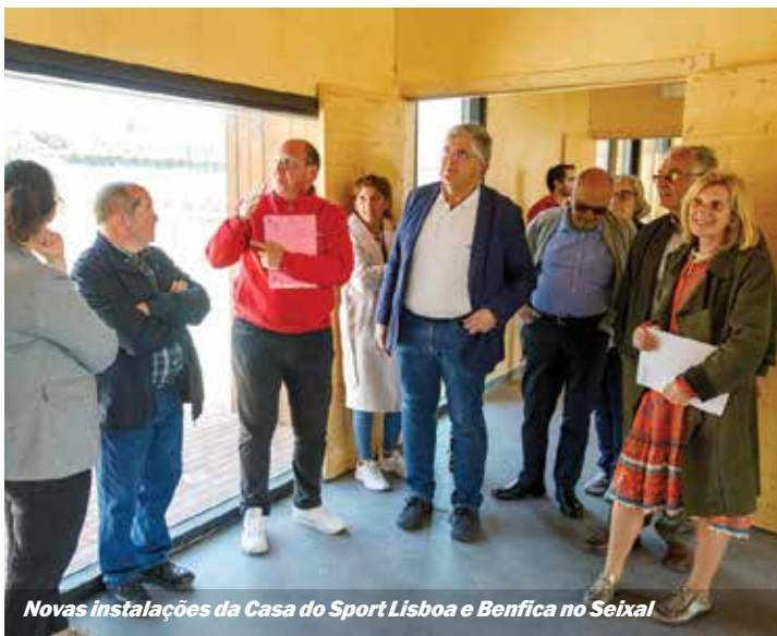
Novas instalações da Casa do Sport Lisboa e Benfica no Seixal