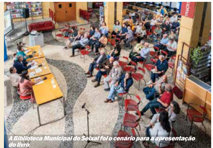
A Biblioteca Municipal do Seixal foi o cenário para a apresentação do livro

revolução não tem ensaio geral». Manuel Duran Clemente foi um dos capitães da génese clandestina do MFA na Guiné, eleito para a 1.ª comissão do Movimento de Capitães (1973), tendo sido um dos líderes do Movimento dos Capitães, na Revolução de 25 de Abril de 1974.