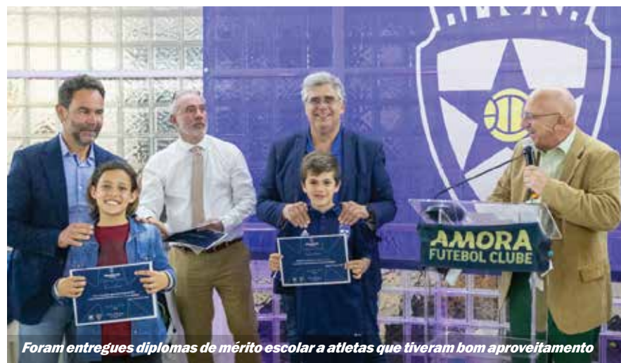
Foram entregues diplomas de mérito escolar a atletas que tiveram bom aproveitamento