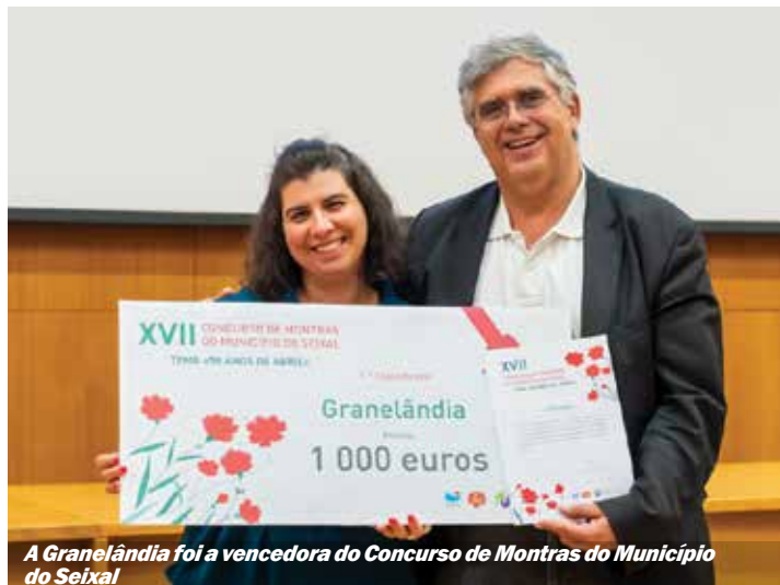
A Granelândia foi a vencedora do Concurso de Montras do Município do Seixal