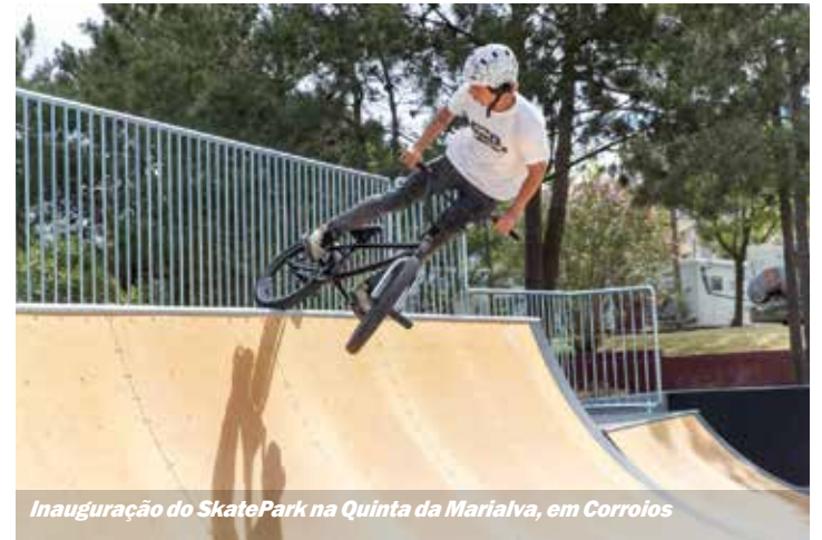
Inauguração do SkatePark na Quinta da Marialva, em Corroios