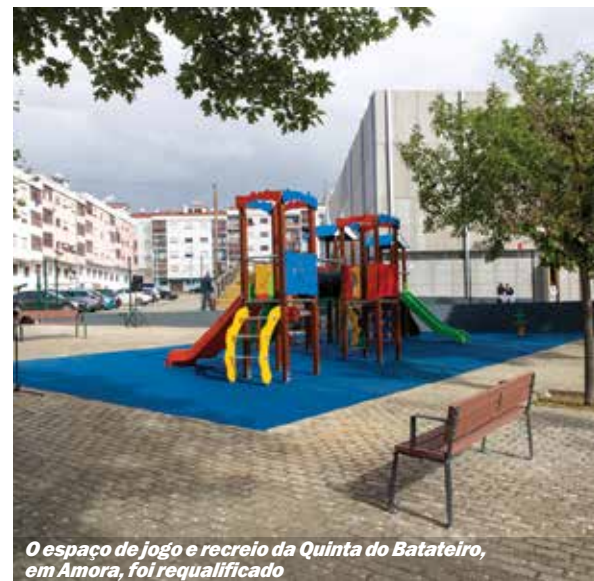
O espaço de jogo e recreio da Quinta do Batateiro, em Amora, foi requalificado