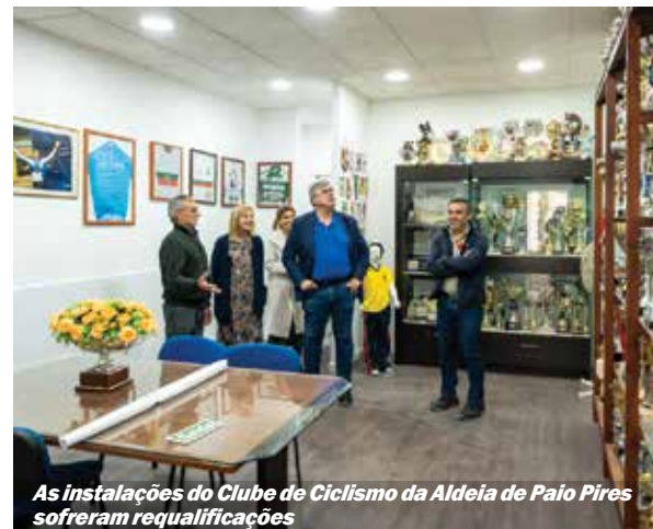
As instalações do Clube de Ciclismo da Aldeia de Paio Pires sofreram requalificações