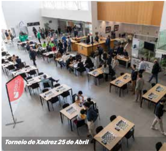
Torneio de Xadrez 25 de Abril