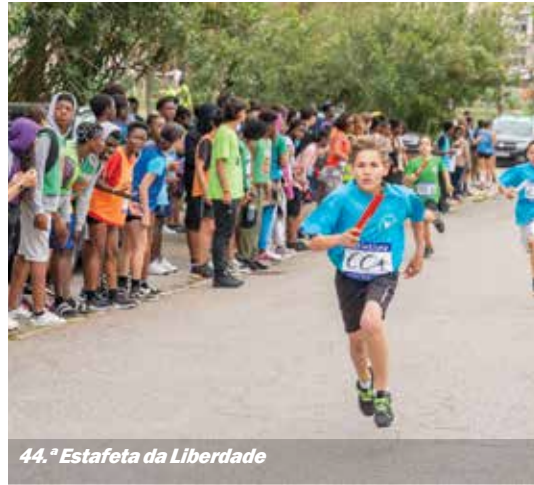
44.ª Estafeta da Liberdade