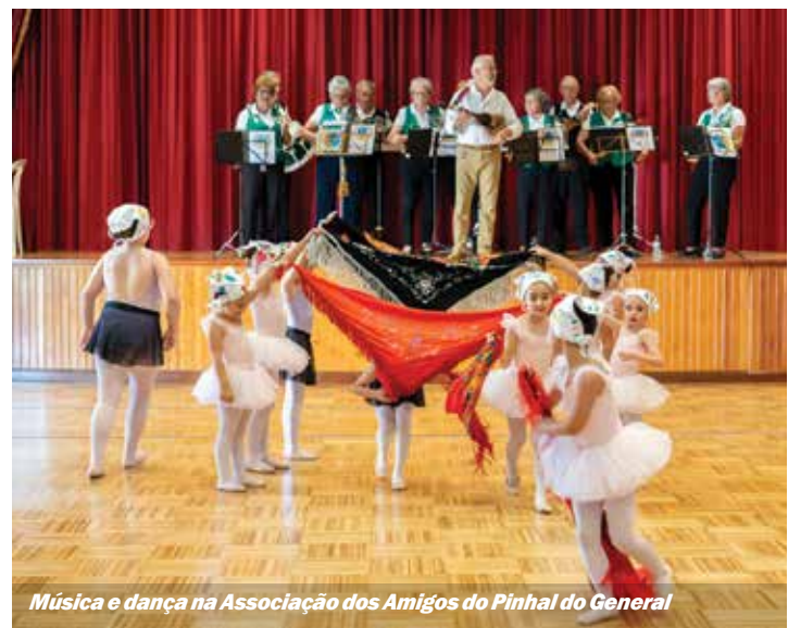
Música e dança na Associação dos Amigos do Pinhal do General