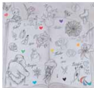
Rabiscos de Emoção, Pulga, 23 anos