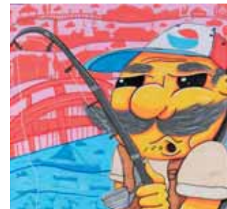
Reflexo Urbano, Ces, 27anos