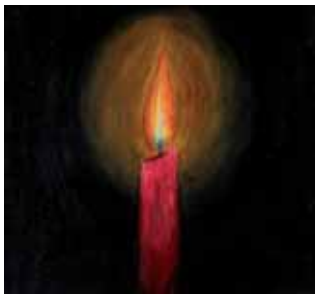
Esperança, Violeta, 17 anos