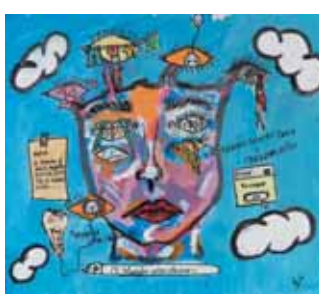
O mundo entre olhares, Nana's room, 22 anos