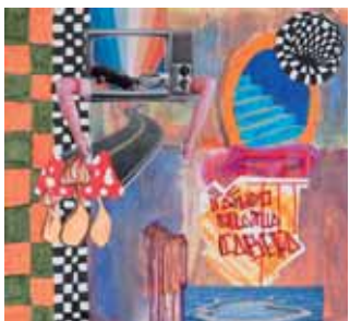
A viagem, TATUDONATUACABEÇA, 21 anos