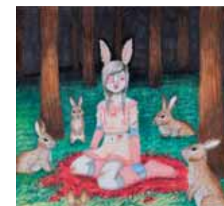
Cute Bunny, @blackuiunicorn.art, 22 anos