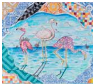
Flamingar no Seixal, O Rodrigues, 29 anos