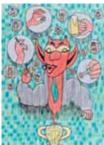
O que move o mundo, Mater Maximilian, 26 anos