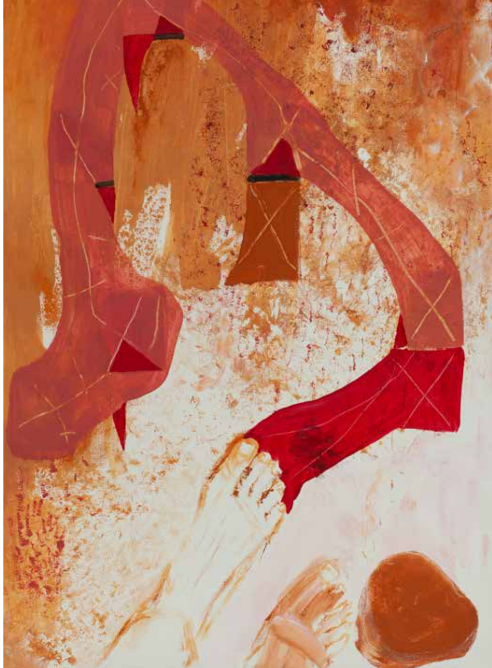
DA SÉRIE PAISAGENS DUPLAS - ORPHEU - PERCURSO I acrílico sobre tela, 100x70 cm, 2023