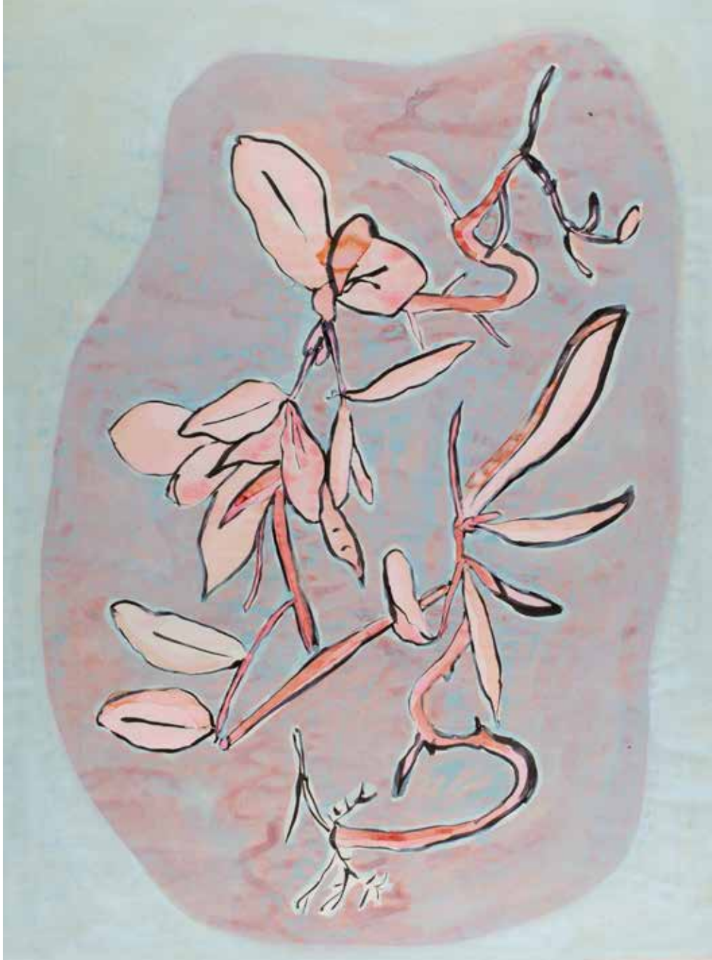
JARDIM EM CONSTRUÇÃO tinta sobre papel, 36,6x46,2 cm, 2020