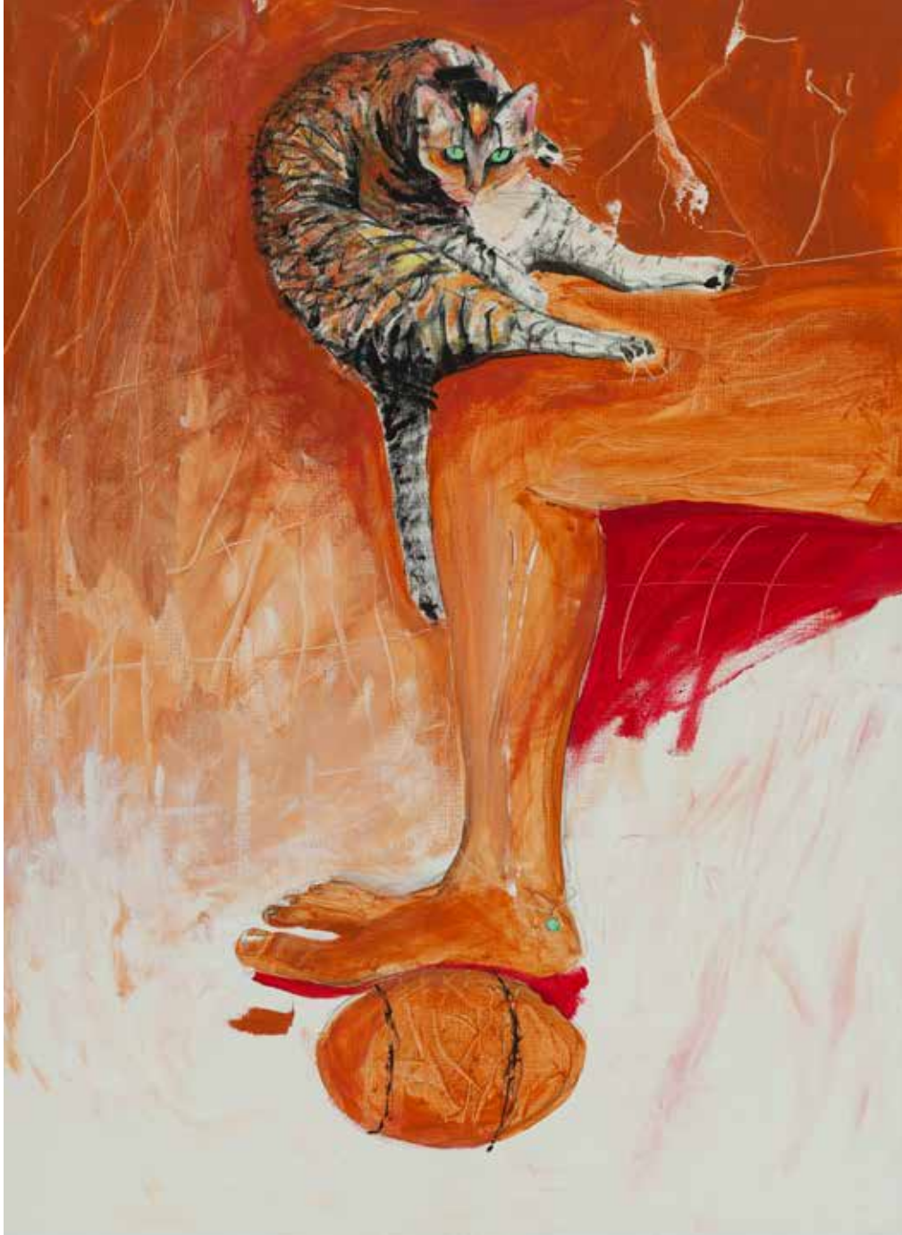
DA SÉRIE PAISAGENS DUPLAS - GATA MIA - PERCURSO III acrílico sobre tela, 100x70 cm, 2023