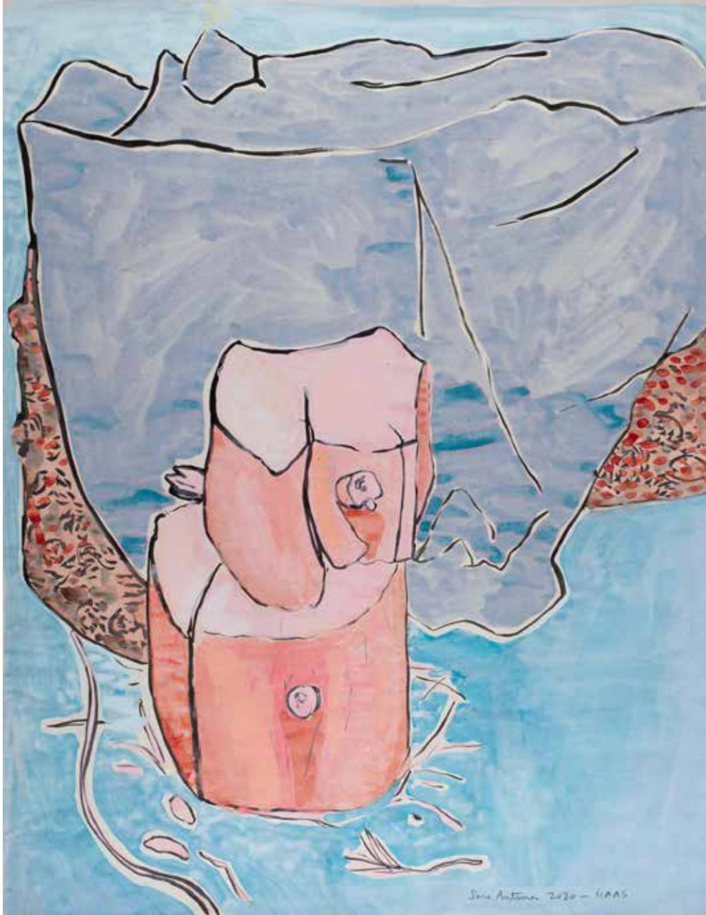
JARDIM EM CONSTRUÇÃO tinta sobre papel, 36,6x46,2 cm, 2020