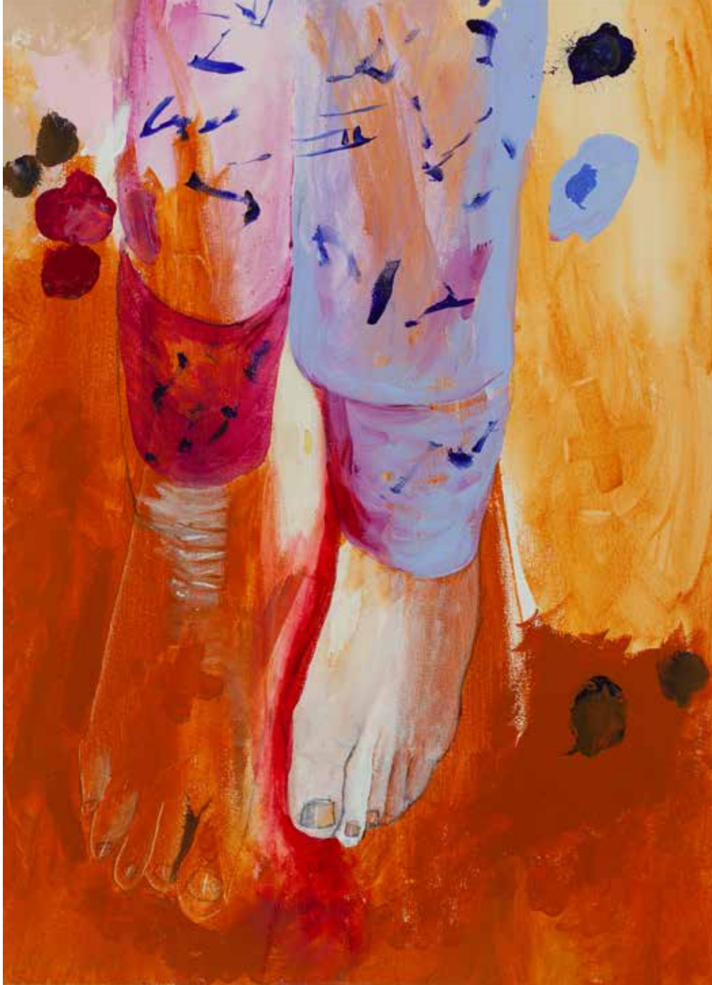
PERCURSO X acrílico sobre tela, 60x40 cm, 2023